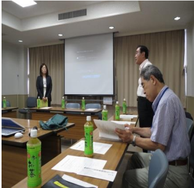
挨拶する相原後援会長

8月8日、グリーンパレスにおいて「振り込め詐欺と悪質商法の手口と対処」についての勉強会を行いました。