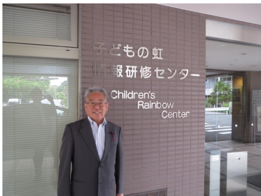
情報研修センター前で

5月2日、横浜市戸塚区にある「子どもの虹情報研修センター」に江戸川区議会の超党派で視察に行きました。